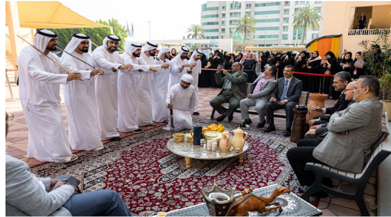
جانب من الاحتفال

والتقاليد في دولة الإمارات، ترسيخاً لها، واعتزازاً بها.