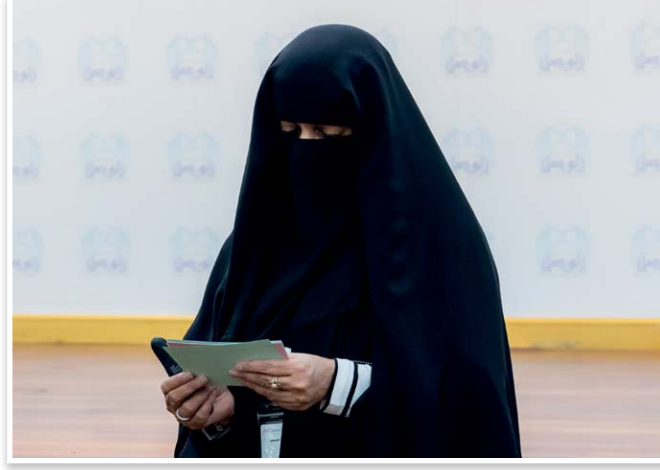
د. الدكتورة بشرى الجسمي

تتجلى أهمية الفتوى في توجيه الأمة وتوضيح الحلال والحرام، وفي قيادة الفرد نحو السلوك الشرعي المصحح والمستقيم. وفي هذا السياق، نلتقي اليوم مع إحدى أبرز الشخصيات الدينية البارزة، الدكتورة بشرى الجسمي، كبير المفتين، التي تتأخر مسؤولية الفتوى والإرشاد بشكل استثنائي.