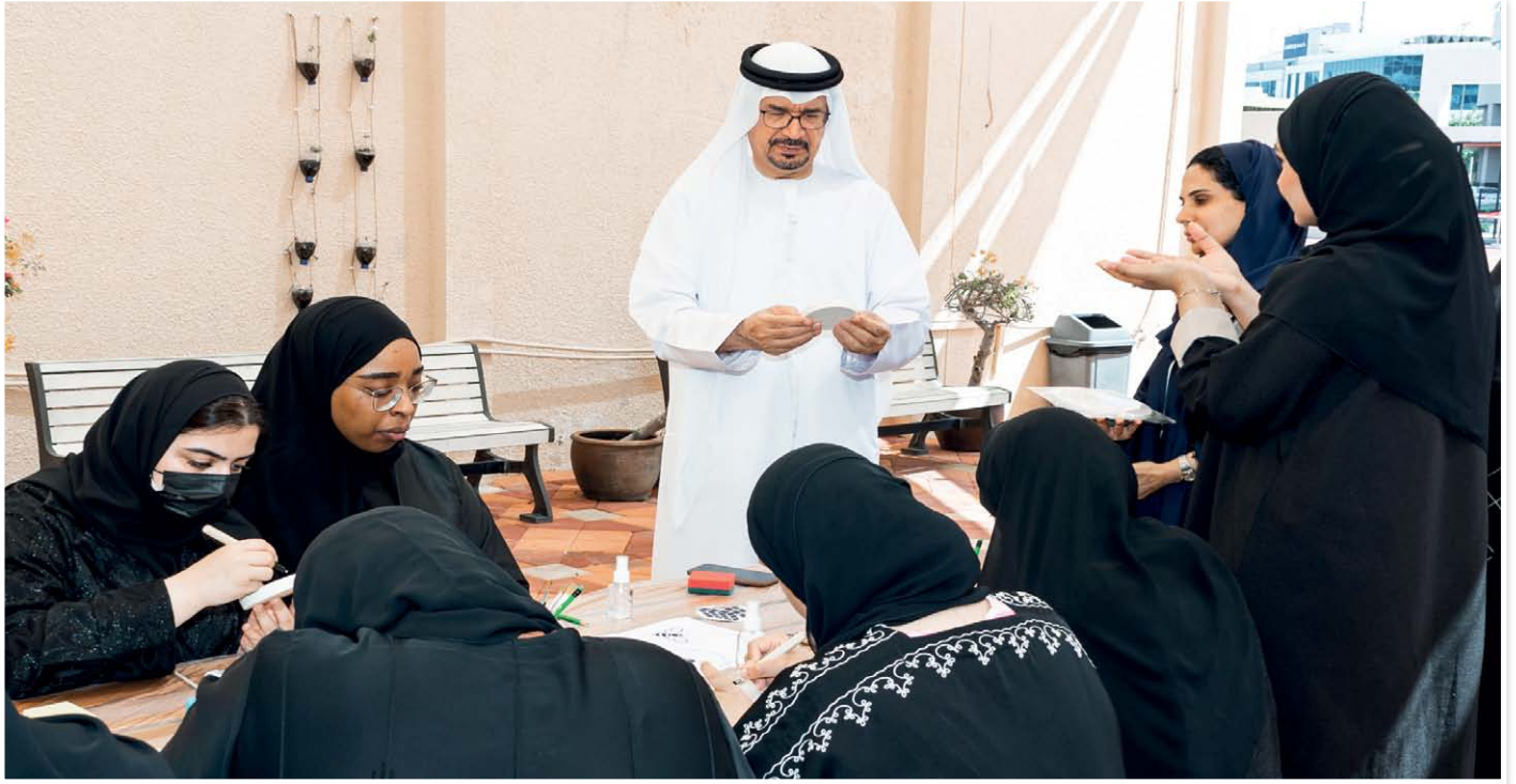
سعادة مدير الجامعة يتفقد ورشة النحت على الجبس

دون دراسته، ويبقى الشغف الذي بداخلي نحو هذه المهارة يدفعني لأبدع.