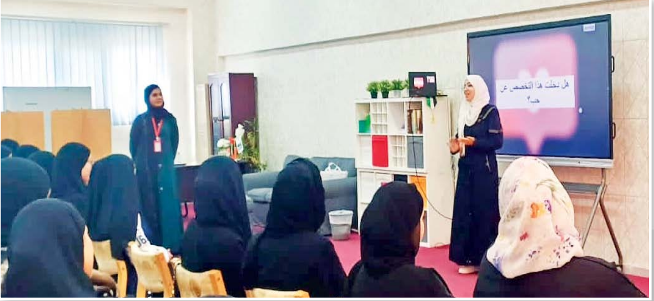
رئيسة اللجنة الثقافية بالمجلس الطلابي مع طالبات الجامعة

نظّم قسم الأنشطة الطلابية بجامعة الوصل، صباح يوم الثلاثاء الموافق 2024/3/19م محاضرة بعنوان: (أنا ولغة الضاد).