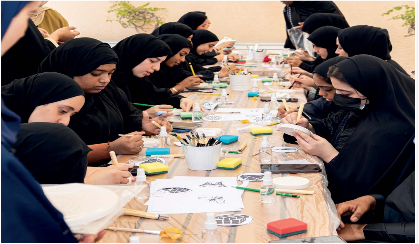
طالبات الجامعة يتعلمن النحت على الجبس