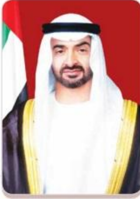
صاحب السمو الشيخ محمد بن زايد آل نهيان (حفظه الله) رئيس دولة الإمارات العربية المتحدة

"الثروة الحقيقية والمكسب الفعلي للوطن يكمن في الشباب الذي يتسلح بالعلم والمعرفة، باعتبارهما وسيلةً ومنهجاً يسعى من خلالهما إلى بناء الوطن، وتعزيز منعته، في كلِّ موقع من مواقع العطاء والبناء".